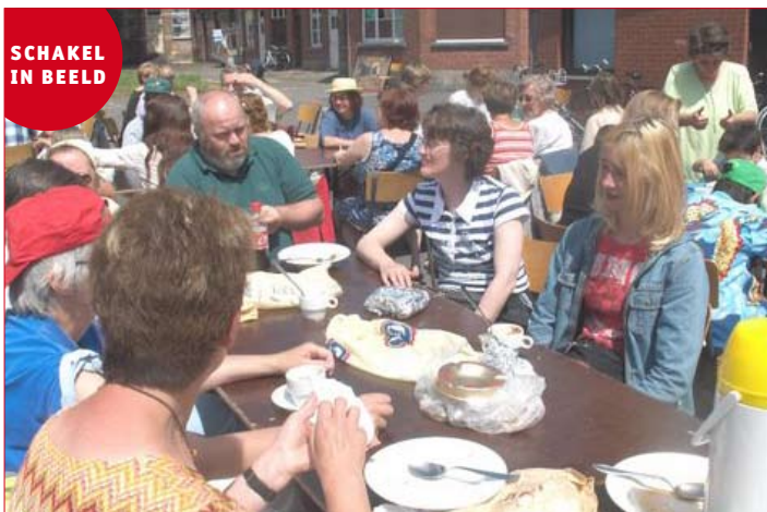
BRUGGE TREKT NAAR ROESELARE: ÔZE PLEKKE ONTMOET T'HOPE